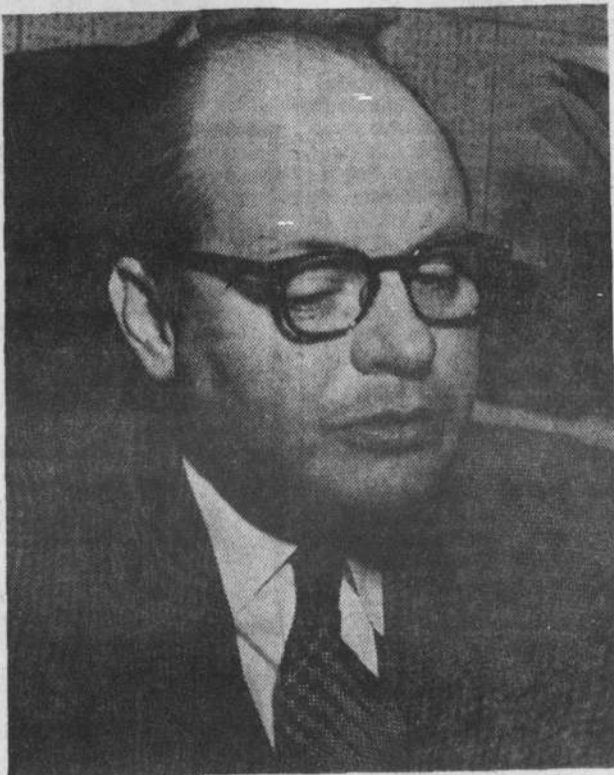
CARLOS LLERAS RESTREPO

GRAN ENTUSIASMO — BOGOTÁ. (IPC)—La presencia de Carlos Lleras Restrepo, al frente de la Jefatura única del Liberalismo, es saludada con gran entusiasmo por los órganos liberales de todo el país los cuales recuerdan en sus comenta-