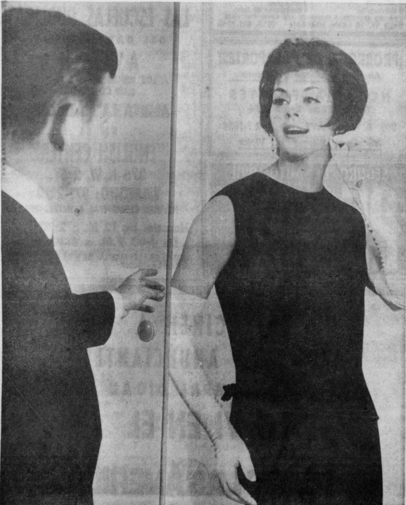
TODA UNIVERSITARIA necesita un traje elegante de noche, y éste es uno de los últimos estilos. El material es ratina francesa. La sobreblusa tiene bordes de cordoncillo de satén. Modelo de la casa Cortina Kinitz, de Nueva York.