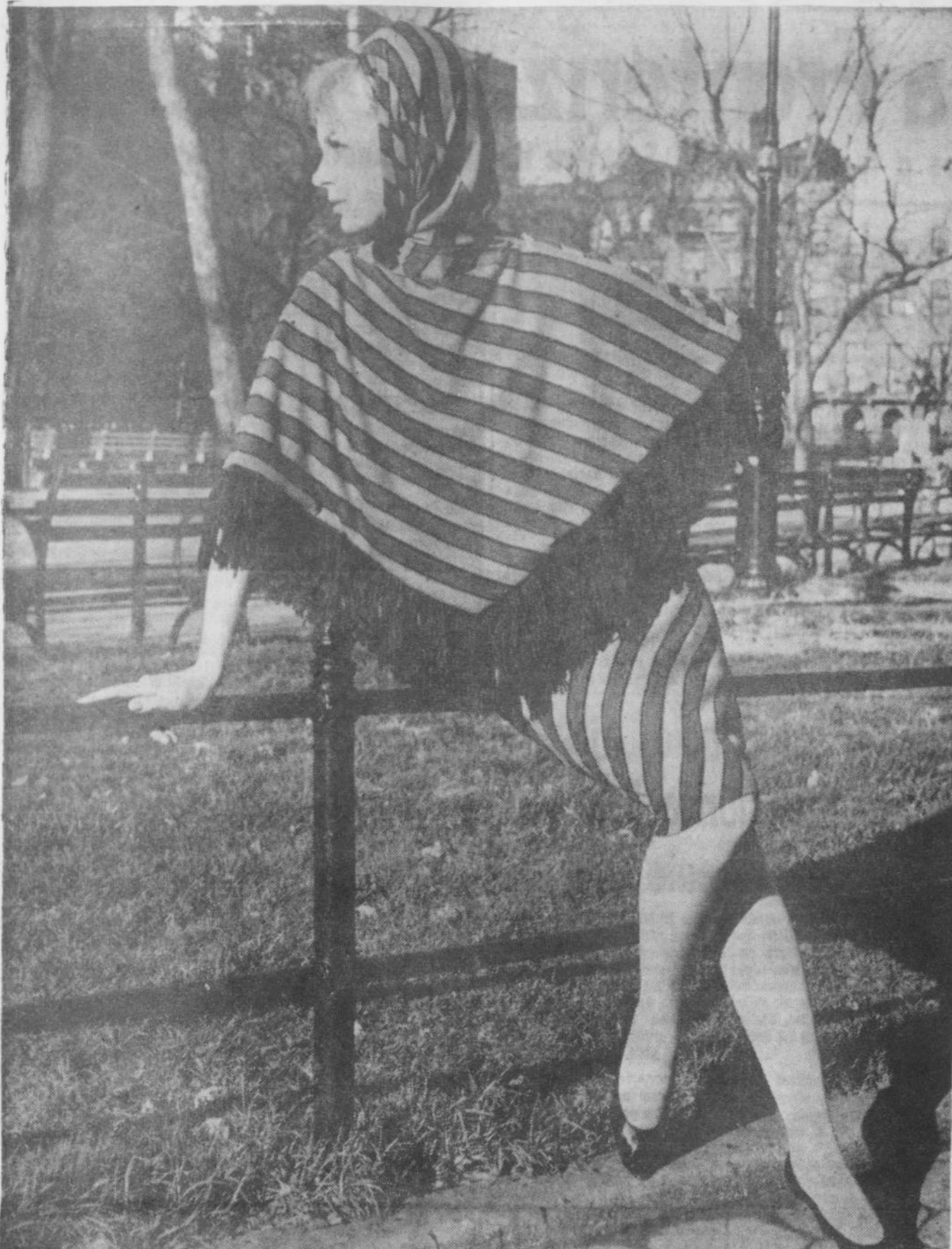
TRAJE DE PUNTO, a rayas diagonales verdes y azules, cuya nota original es el mantón español que lo completa. El material es creslán. Diseñado para jóvenes colegiales y universitarias. Original de la firma Ceslán, Nueva York