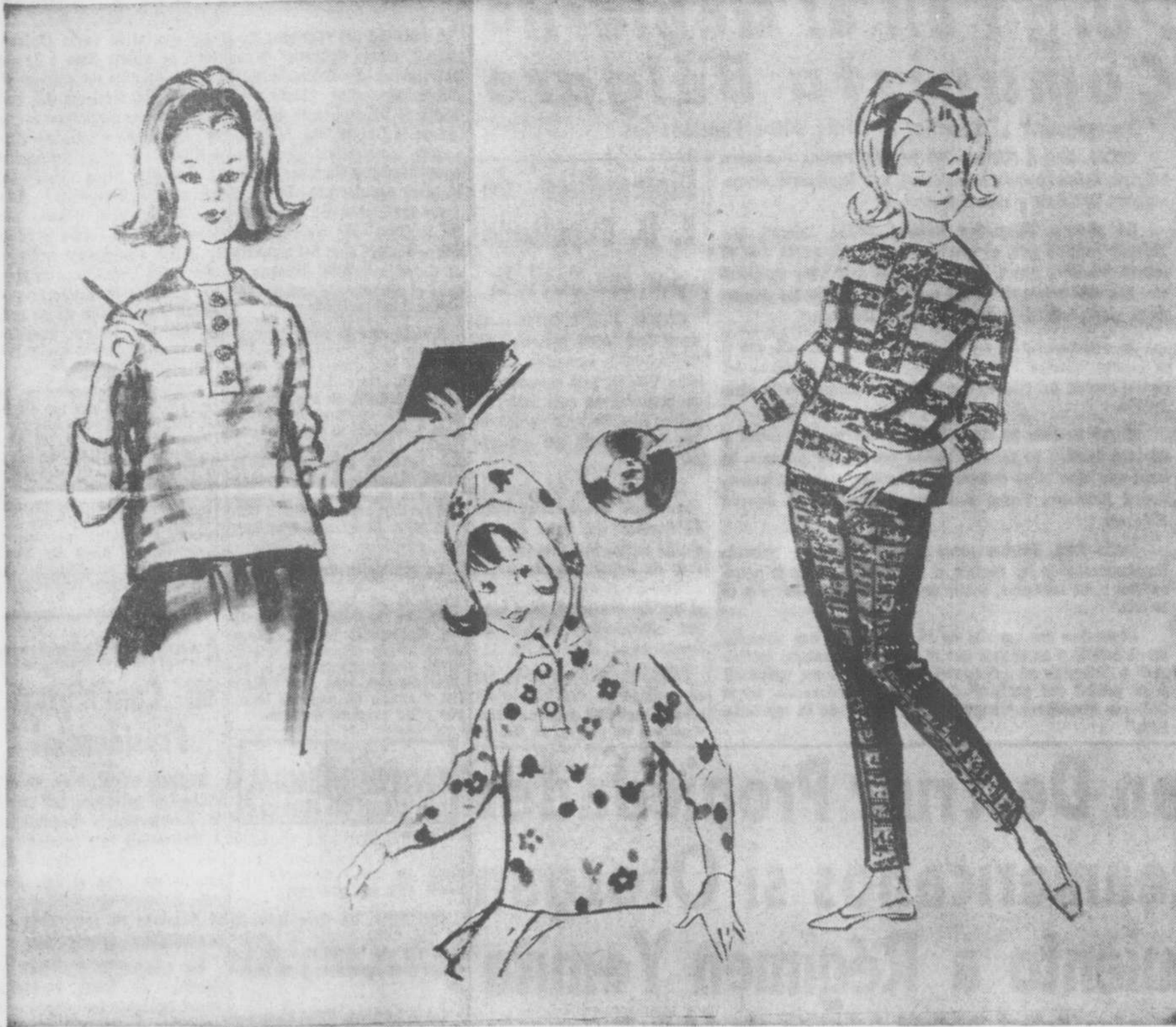
He aquí nuevos tipos de suéters para niñas: a la izquierda, uno de tela de algodón con bandas gris y blancas y adornado con cuatro botones de hueso blancos; al centro, uno de tela estampada, con capucha en juego. A la derecha, uno de punto, con bandas anchas a dos colores y cuatro botones frontales de adorno. Modelos de la casa Regal Knitwear, de Nueva York.