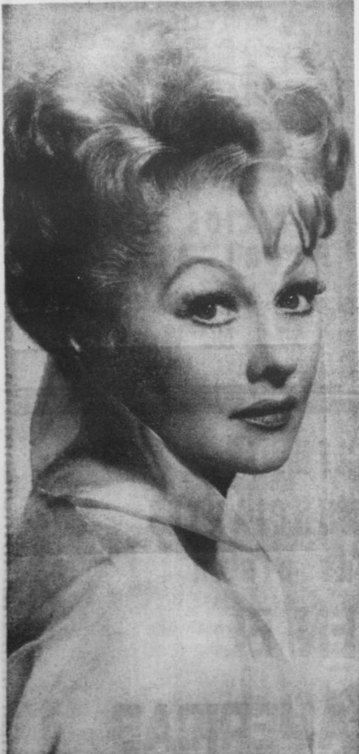
La popular actriz Lucille Ball revela aquí el secreto de su ilimitada energía.

hace espuma como un jabón cuando me enjuago con agua. Me enteré de este aceite hace mucho tiempo. Fue un consejo de mi maquillador y lo he usado desde entonces. Si usted no puede encontrar algo bueno para quitarse el maquillaje, tendrá problemas con su cutis," terminó diciendo Lucy.