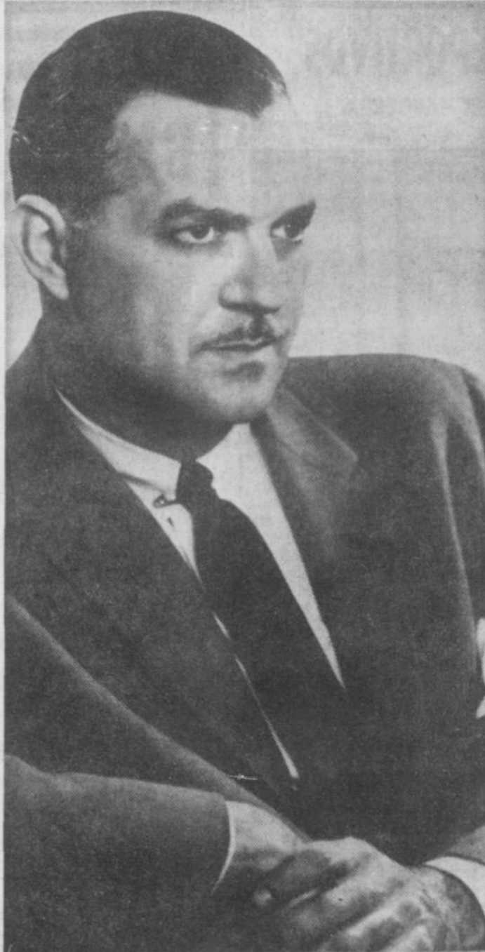
JORGE BOLET, reconocido pianista latinoamericano de fama internacional, que tocará con la Orquesta Sinfónica Nacional de Washington en Constitution Hall el 6 y 7 de noviembre. El señor Bolet será solista en la Sinfonía No. 7 de Beethoven y el Concerto No. 2 para Piano de Brahms.

— No menos de 50 acusaciones por falsificación serán formuladas contra un ex empleado de la oficina local de Seguro por Desempleo del Departamento del Trabajo, quien se encuentra actualmente en Nueva York, a donde se dirigió después de haber falsificado numerosos cheques destinados a personas desempleadas. El fiscal Carlos Noriega ha venido investigando minuciosamente el caso, habiendo tomado declaraciones a numerosas personas, llegando a la conclusión que deberá someter el expediente de la investigación a un magistrado, para que éste determine si hay causa de acción.